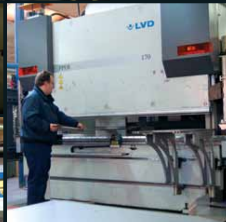
Alsidiq moderne maskinpark